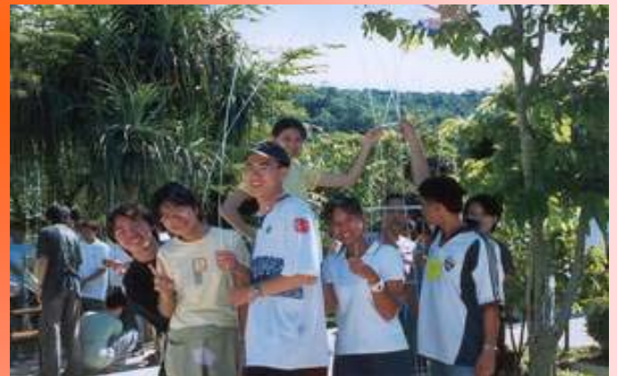
โครงการพัฒนนิเทศน์ นศพ.ปี 3 จัดที่เขาลาดดา อ.สิชล จ.นครศรีธรรมราช สถานที่นี้ข่าวแว่วมาว่าสวยงามมาก เราจะเห็นภูเขา ทะเล น้ำตก ได้จากที่นี่เลย