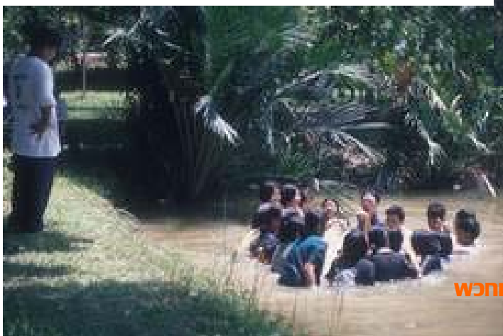
พวกเรา...จับเฮียแกลงแก้ผ้าตีหม