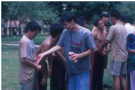
ใส่น้ำแข็งให้มันสดหน่อยนะน้อง