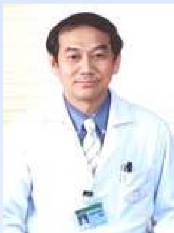
สวัสดีครับ พี่น้องศิษย์เก่า ม.อ. ที่รักทุกท่าน

พวกเราคงทราบข่าวจากสารศิษย์เก่าฉบับที่แล้ว นะครับว่าปีนี้ปีนี้ปีครบรอบ 30 ปี นับตั้งแต่ก่อตั้ง คณะแพทย์ ม.อ. ของเรามา ทางคณะฯ และสมาคมศิษย์เก่า จึงได้ร่วมกันจัดกิจกรรมทั้งด้านวิชาการและกิจกรรมสาธารณกุศล เพื่อเป็นการเฉลิมฉลองไปตลอดทั้งปี 2545 นี้ โดยเฉพาะอย่างยิ่งงานประชุมวิชาการประจำปี ซึ่งจะจัดขึ้นระหว่างวันที่ 14-16 สิงหาคม 2545 ทางคณะกรรมการจัดประชุมได้เตรียมการไว้อย่างเต็มที่ ตามกำหนดการและรายละเอียดที่ทางคณะฯ ได้มีการประชาสัมพันธ์ผ่านทางข่าวฉบับที่ผ่านมาให้ศิษย์เก่าทุกคนทราบ