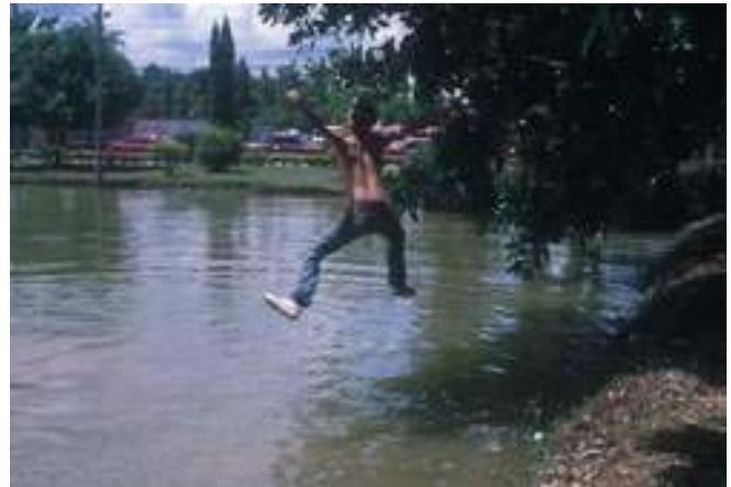
เปิดท่อมใหม่...มีน้องใหม่....หน้าใหม่ แต่ลองชมรับน้องแบบเก่าๆ ...ปี 39-40