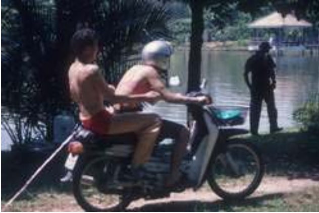
กลุ่มนักร้องประจำหมู่บ้าน