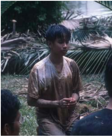
มีบุญายน