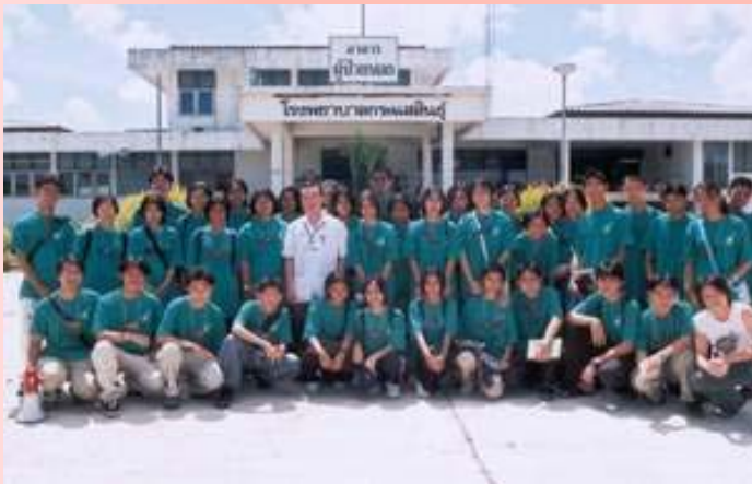
"โครงการเพาะกล้า" ที่ทางสโมสรนักศึกษาแพทย์จัดขึ้น เพื่อให้นักเรียน ม.ปลาย ได้มาดูงานก่อนตัดสินใจเลือกเรียน งานนี้คุณหมอไฟ รุ่น 19 ดูเด่นมาก...

มีเสียงบอกผ่านมาว่าอยากเห็นภาพกิจกรรมของน้องๆ นักศึกษาแพทย์รุ่นปัจจุบันบ้าง ทางกองบรรณาธิการเลยต้องรีบเสาะหากันใหญ่ก่อนปิดต้นฉบับรอบนี้ ลองดูกันนะครับว่ากิจกรรมของรุ่นน้องสมัยนี้เขาทำกันเหมือนรุ่นเก่าๆ หรือไม่ แต่สำหรับความคิดของผมเนี่ย เดียวนี้มีกิจกรรมให้รุ่นน้องทำมาก และแต่ละงานล้วนแต่มีความโดดเด่นสร้างสรรค์ มีประโยชน์ต่อสังคมหลายงานเลยทีเดียว