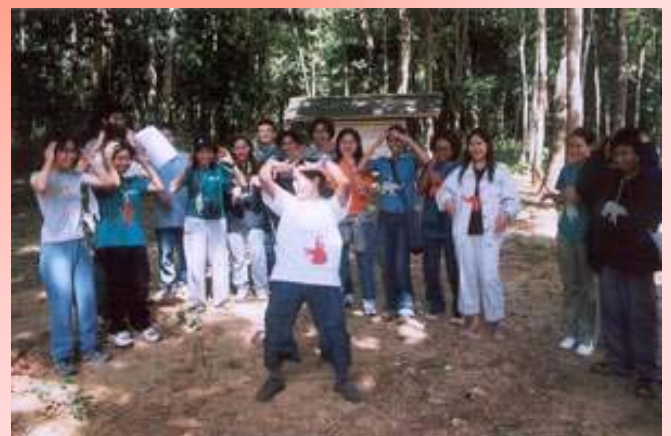
โครงการพัฒนนิเทศน์ นศพ.ปี 2 จัดที่เขานูเขาย่า จ.พัทลุง ที่เห็นในภาพ เป็นการแสดงท่าของกลุ่ม "group of death" มันส์อย่าบอกใคร