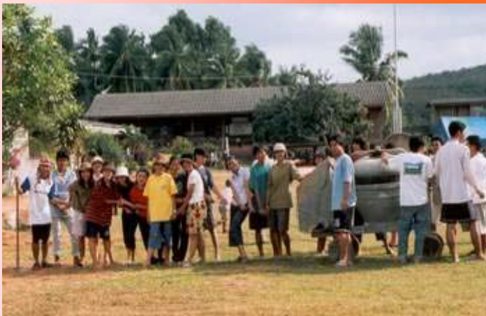
โครงการค่ายอาสา ปีนี้จัดขึ้นที่ รร.บ้านแหลมหาด อ.กระแสดินธุ์ ดูท่าทางแข็งขัน ไม่รู้ว่าช่วยกันดึงไปถ่ายรูปไปได้ไกลกี่เมตร