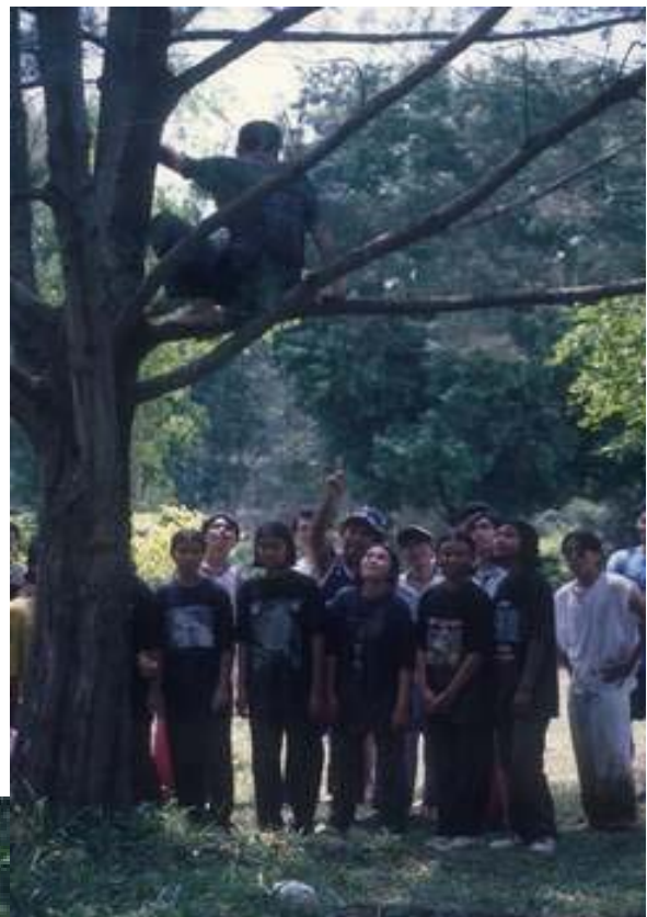
ถือว่าเป็นชนชั้นสูงริ....ลงมา