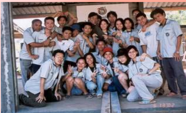
ผลงานที่เห็นคือ ศาลาเอนกประสงค์ รร.บ้านแหลมหาด