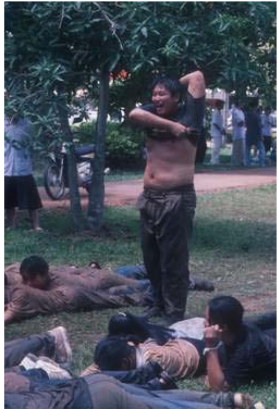
ซีเลตภูเขา...โอบมันต่ำ