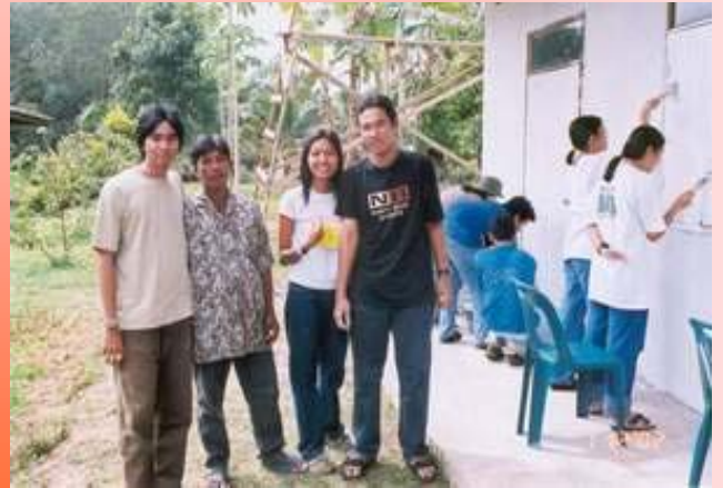
นศพ. ได้จัดงานวันเด็กที่ รร.บ้านไร่ อ.สะบ้าย้อย ซึ่งปีที่แล้ว ได้มาจัดค่ายอาสา กันที่นี่ ถึงคราวต้องมาชมแซมบ้าง