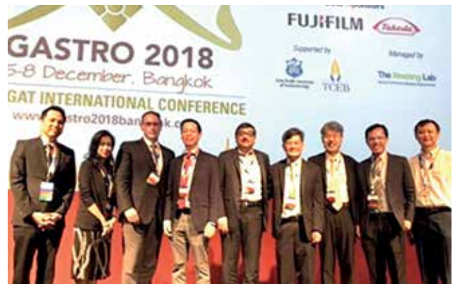
สมาคมแพทย์ส่องกล้องทางเดินอาหารไทย