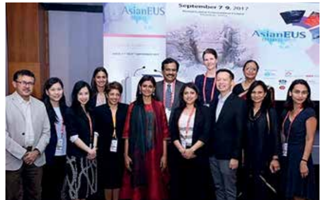
Women in Gastroenterological Network Asia Pacific