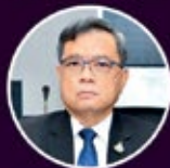
ศ.บพ. นครชัย เพื่อนปฐม

09.00-10.00 น. Plenary session การพัฒนาทางการแพทย์ในอนาคตตามเป้าหมาย การพัฒนาอย่างยั่งยืน (Sustainable Development Goals) วิทยากร: ศ.บพ.นครชัย เพื่อนปฐม Moderator: พศ.ดร.นพ.ธารานันท์ ต้นธนาธิป 14.50-16.00 น. (Online) "Life under the sea" วิทยากร: พศ.ดร.ธรรณ์ ชำรงนาวาสวัสดิ์ ภาควิชาวิทยาศาสตร์ทางทะเล คณะประมง มหาวิทยาลัยเกษตรศาสตร์