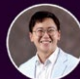
พศ.ดร.นพ.วรุฒม์ อุจน์จิตสกุล